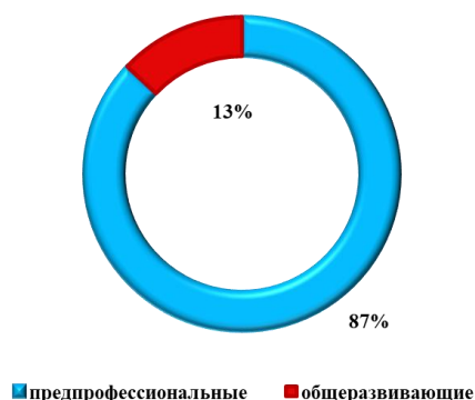
Распределение учащихся по программам (%)